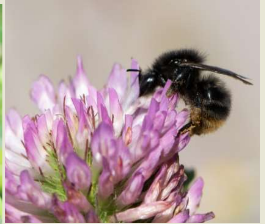
Mörk form av haghumla