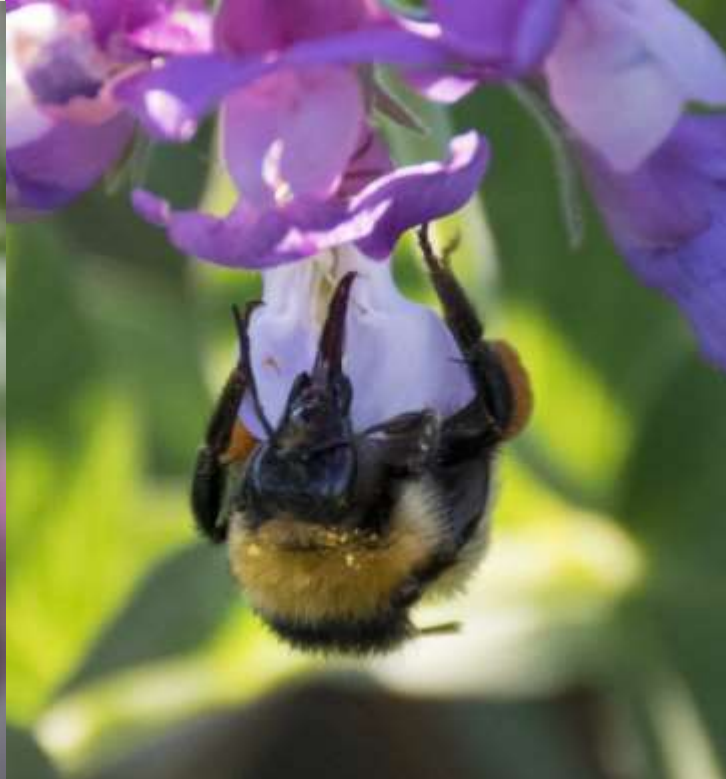
Klöverhumla (rödlistad) Strandvial