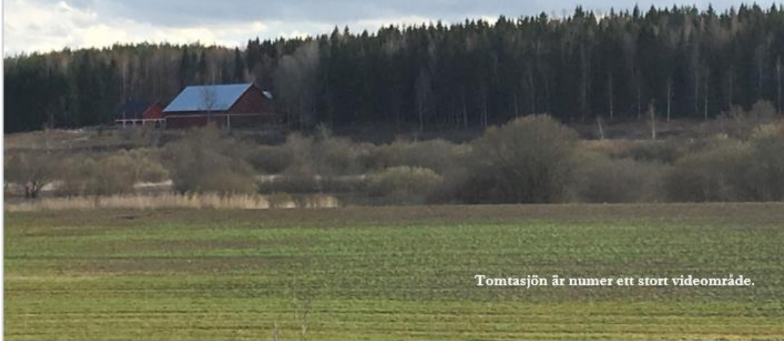
Tomtasjön är numer ett stort videområde.

Återskapandet av 40 hektar grund fågelsjö som varit försvunnen i 150 år