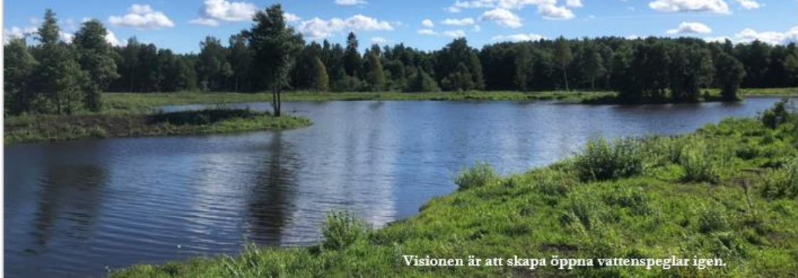
Visionen är att skapa öppna vattenspeglar igen.

En dämning i utloppet samt urgrävning av delar av området kommer skapa en mosaik av grunda och djupa vattenytor, med gott om öar skyddande buskage. Förhoppningen är att kunna nyskapa en av Upplands allra häftigaste fågelsjöar.