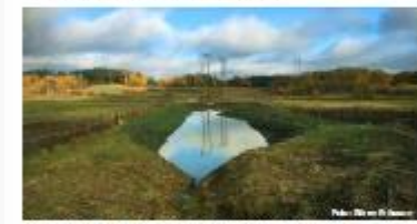
Fosfordammen är en effektiv metod för att fånga fosfor som är på väg ut från åkermarken.

En fosfordamm är ett bra sätt att fånga fosfor som är på väg med vattnet från åkermarken ut mot sjöar och vattendrag. Dessutom blir dammen ett bra ställe för beslag på gödning. Djur och växter som går till vattnet kommer att förlora en del fosfor.