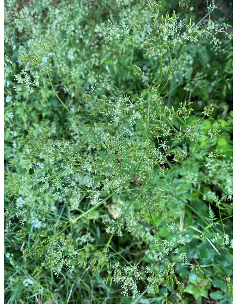
Bilden visar hundkäk