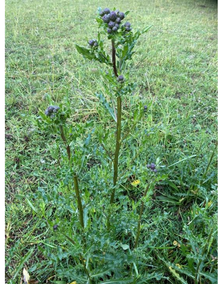
Bilden visar ogräset åkertistel.