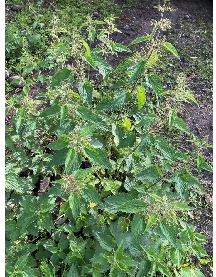
Bilden visar brännässlor