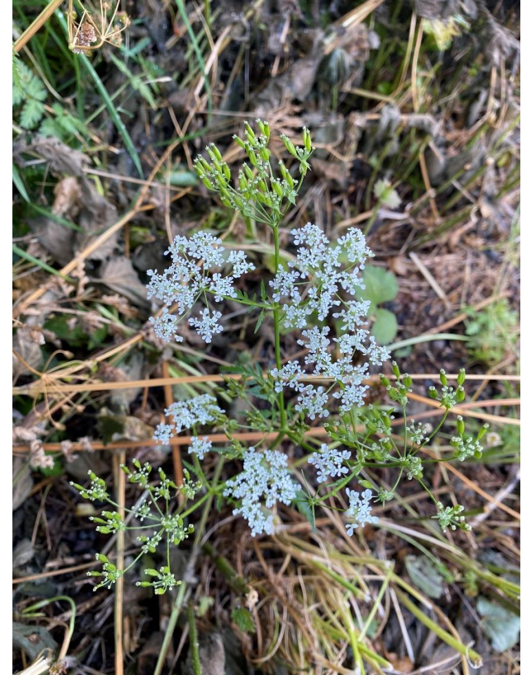
Bilden visar en planta med hundkäs som blommar