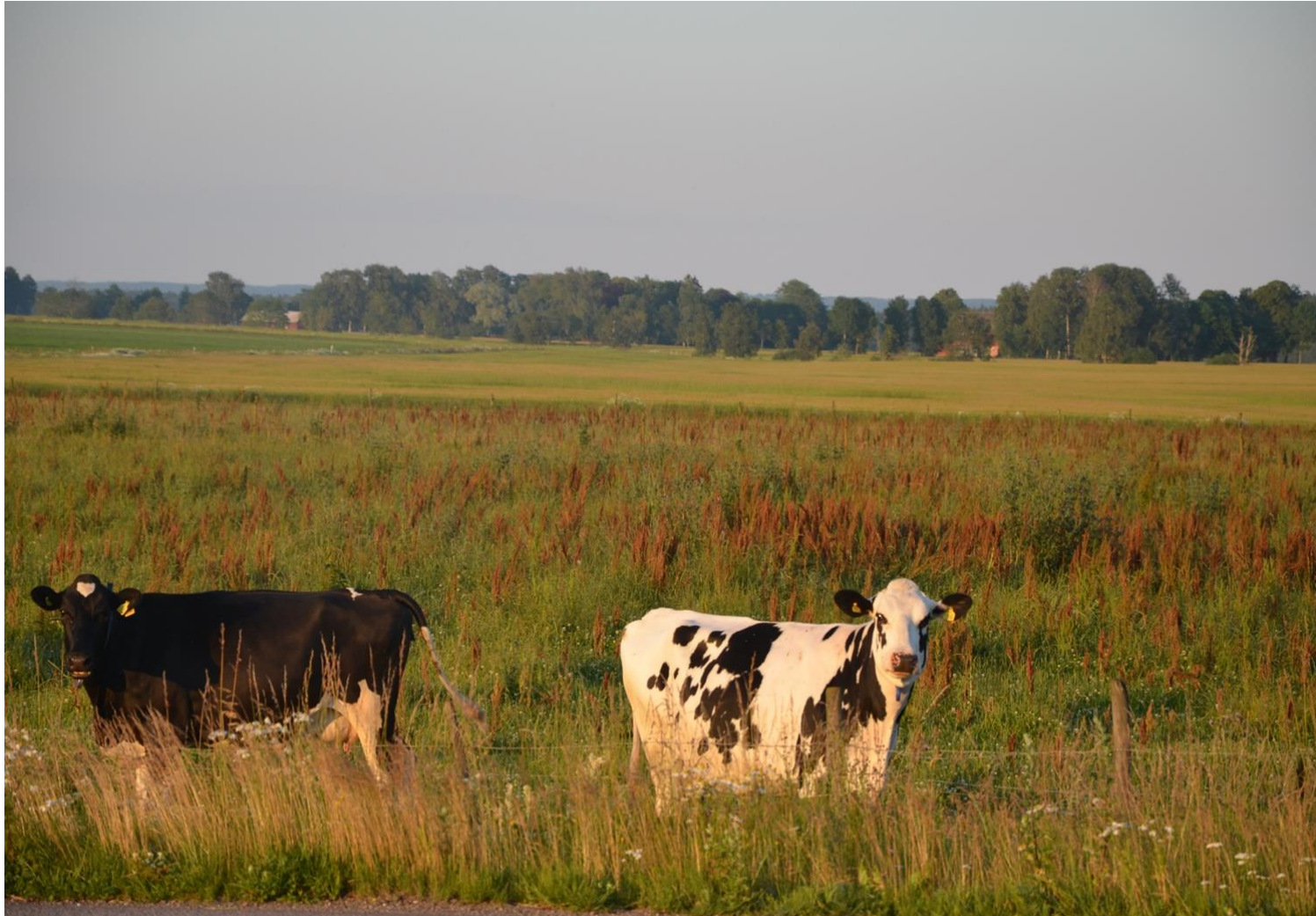
Bilden visar en betesvall med mycket skräppor.