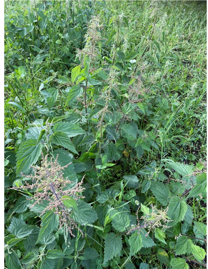
Bilden visar brännässlor