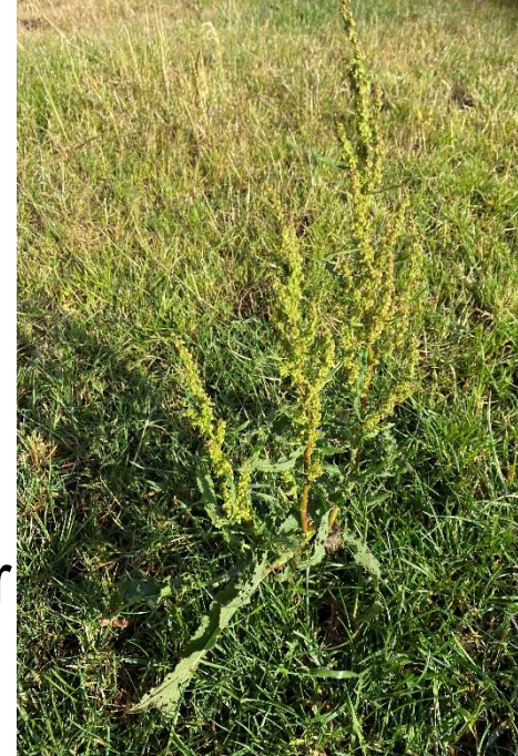
Bilden visar en skräppa med gröna frön på fröstockarna.