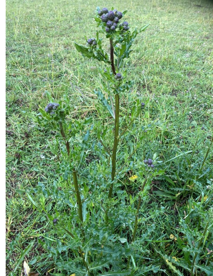
Bilden visar ogräset åkertistel