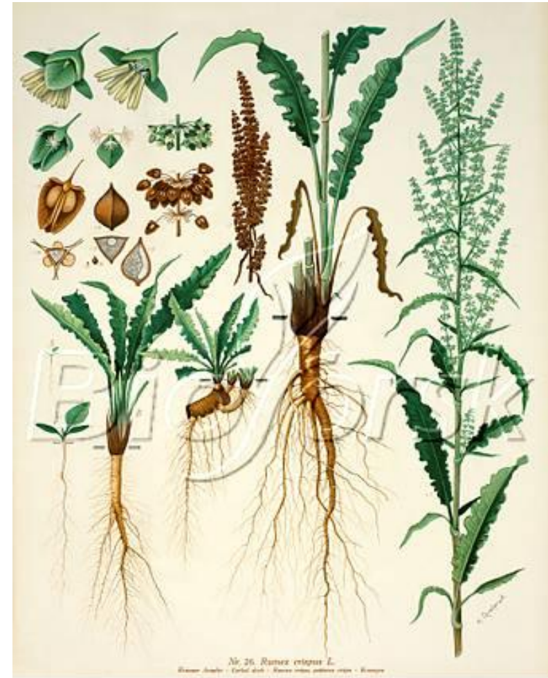
Illustration: Krut Quetved

Bilden visar olika delar av växten skräppa