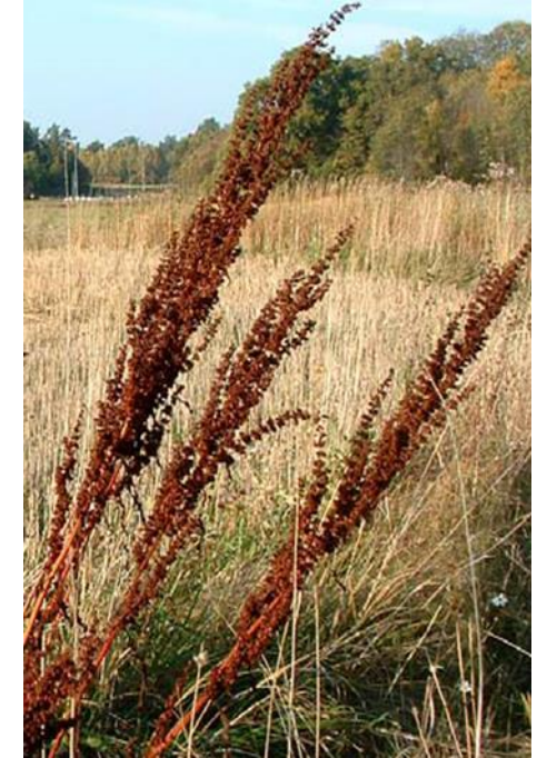
Bilden visar en skräppa med bruna frön på fröstockarna