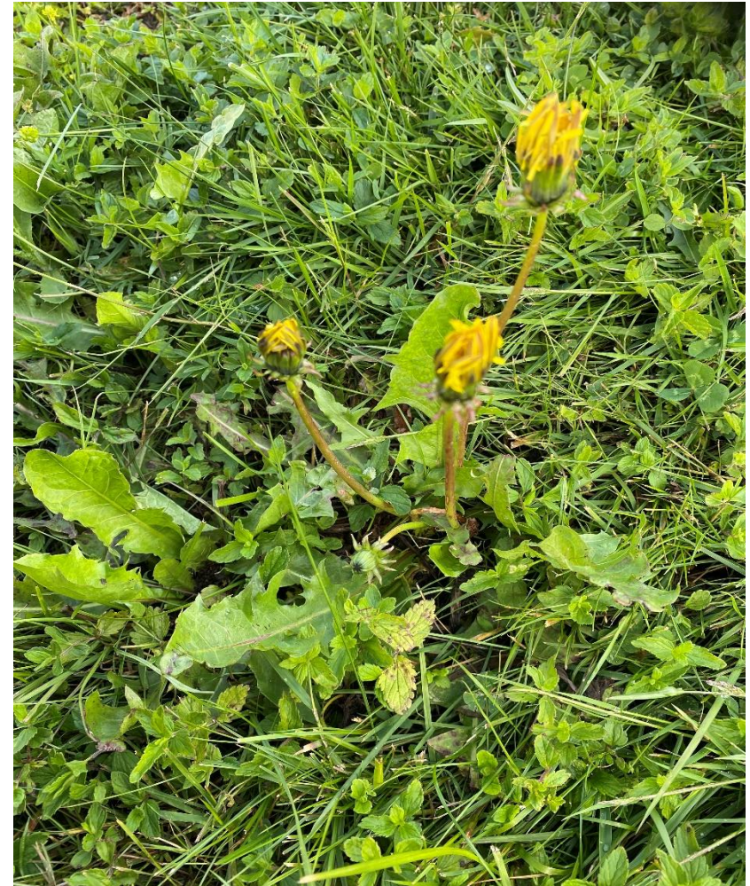
Bilden visar en maskros