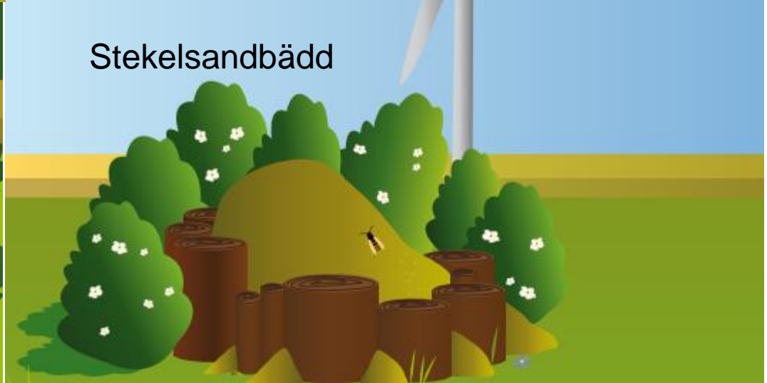
Bilder från Vindkraft i slättlandskapet, Jordbruksverket 2011